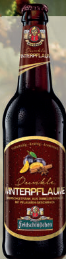
FELDSCHLÖBCHEN Dunkle Winterpflaume