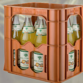
BAD BRAMBACHER Garten-Limonade alle Sorten