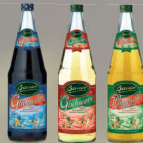
BAUER Glühwein, rot, weiß, Zwergenpunsch, Winterapfel